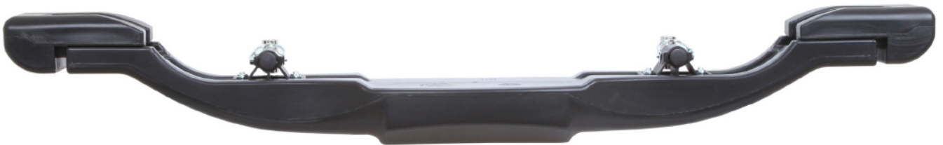
Photo vue de côté avec supports / Photo from the side with supports