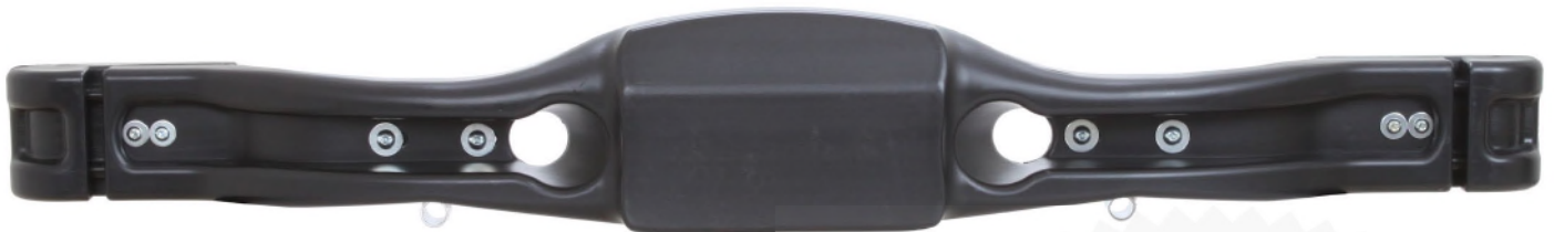
Photo vue arrière de la protection avec supports / Photo of the rear of the protection with supports

Signature et tampon de l'ASN / Signature and stamp of the ASN