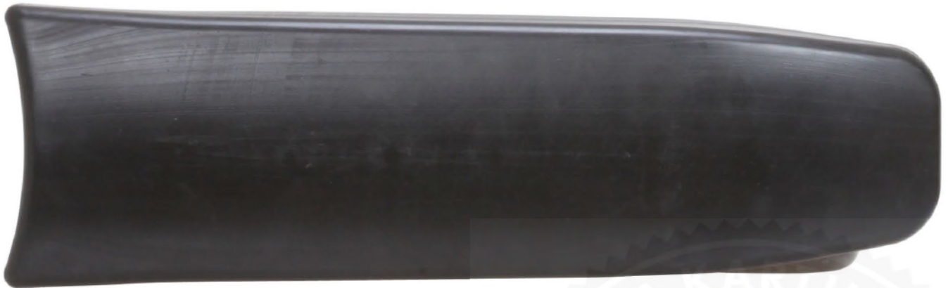
Photo vue de côté de la carrosserie latérale / Photo of the side of the bodywork